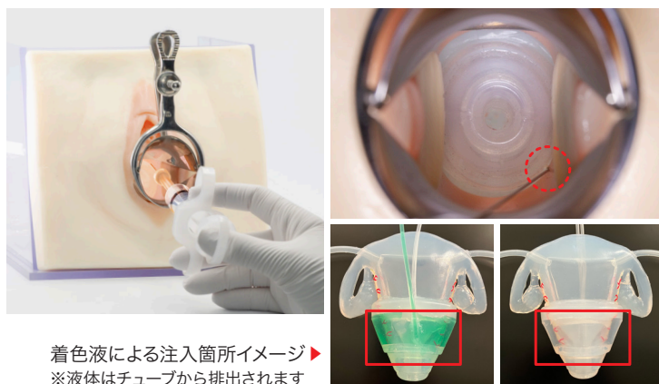
着色液による注入箇所イメージ▶ ※液体はチューブから排出されます